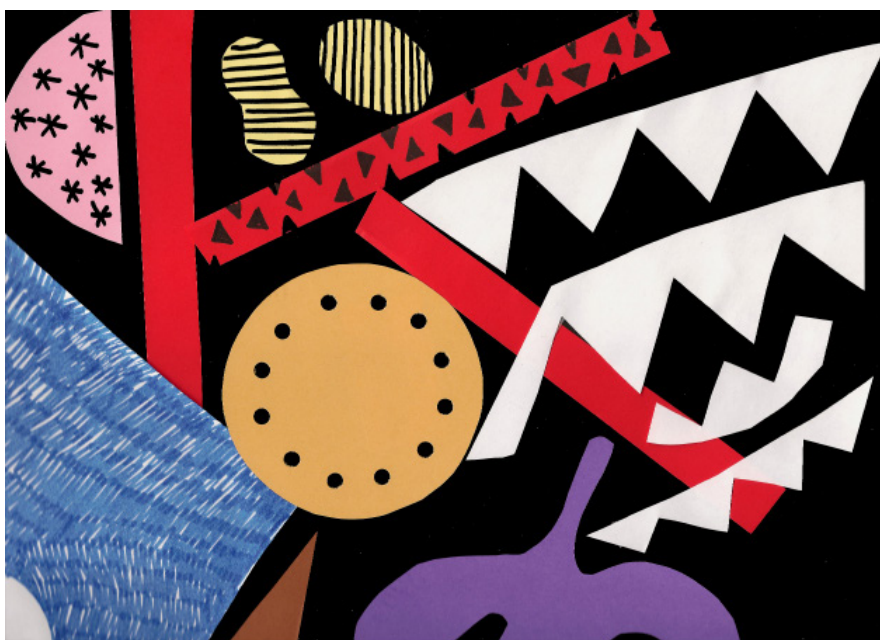
Les Tableaux vivants , collage (détail), 2017 © Karina Bisch et l'ADAGP, Paris, 2017

Du 7 octobre au 22 décembre 2017, Micro Onde, Centre d'art de l'Onde à Vélizy-Villacoublay, présente dans la Galerie, une exposition inédite de l'artiste Karina Bisch.